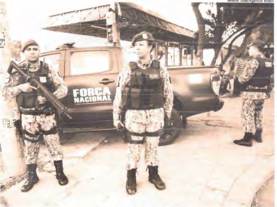
Efetivo da Polícia Militar será reforçado

O governo do Ceará planeja convocar até 1,2 mil policiais e bombeiros militares da reserva para reforçar o patrulhamento nas ruas e, assim, enfrentar a onda de ataques criminosos no estado, que chegou ontem (14) ao 13º dia.