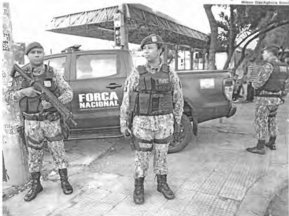
Esquadrão da Polícia Militar será reforçado

O governo do Ceará planeja convocar até 1,2 mil policiais e bombeiros militares da reserva para reforçar o patrulhamento nas ruas e, assim, enfrentar a onda de ataques criminosos no estado, que chegou ontem (14) ao 13º dia. A convocação dos militares da reserva é parte das medidas aprovadas pela Assembleia Legislativa e sancionadas pelo governador Camilo Santana. Além da convocação emergencial de militares reformados nos últimos cinco anos, aprovados nos exames de saúde e físicos, as novas